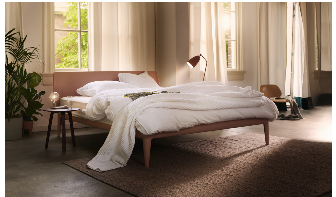
Auping Essential bed

Volschuimrubber voorzien van duizenden ventilatiekanaaltjes. Schuimrubber voelt van nature direct warm aan en volgt de rondingen van het menselijk lichaam zeer gemakkelijk. Voor deze afdeklaag worden zowel natuurlijke (wol, katoen) als synthetische materialen gebruikt (anti-allergie). Ten slotte komt dan de tijk, meestal damast of badstof en tegenwoordig vaak voorzien van een rits om het reinigen en/of verwisselen te vergemakkelijken.