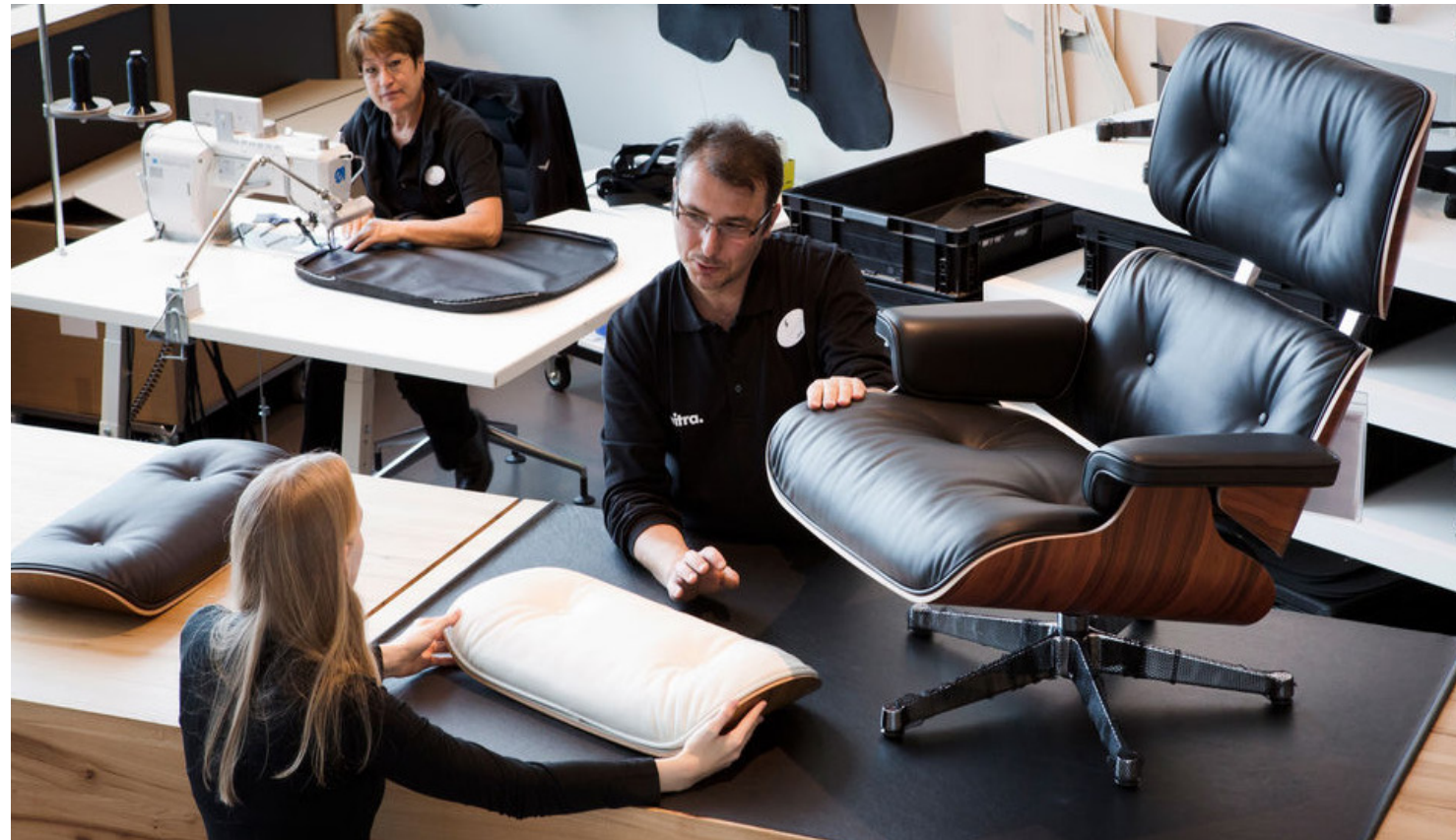
Vitra Eames Lounge Chair