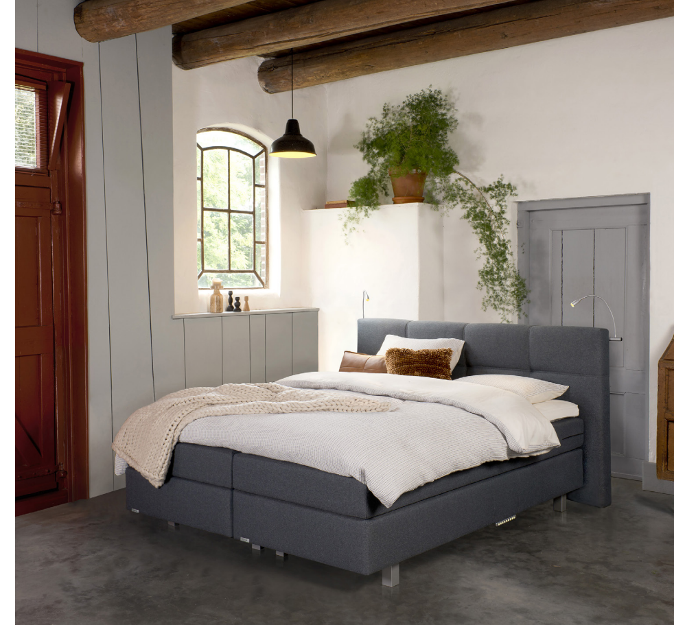
Avek Ninety boxspring

Is het buiten kouder dan binnen, dan is extra voorzichtigheid nodig. Beperk het luchten dan tot ca. 10 minuten. Het gevaar is juist dan aanwezig dat de nog warme vochtige lucht in je matras extra afkoelt en daarbij ontstaat condensatie.